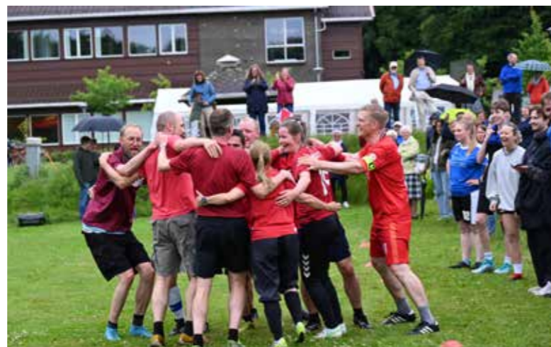
De gamle feiret sitt trøstemål. Om det var med eller uten stil forblir usagt.