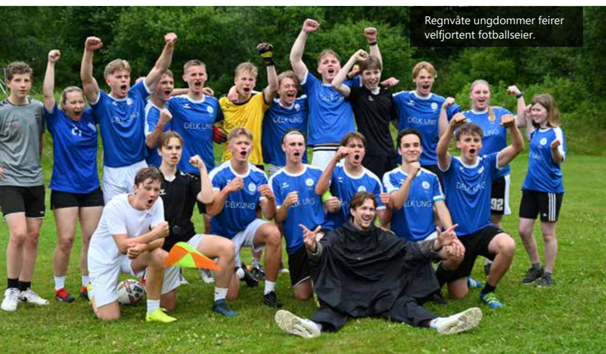
Regnvåte ungdommer feirer velfjortent fotballseier.