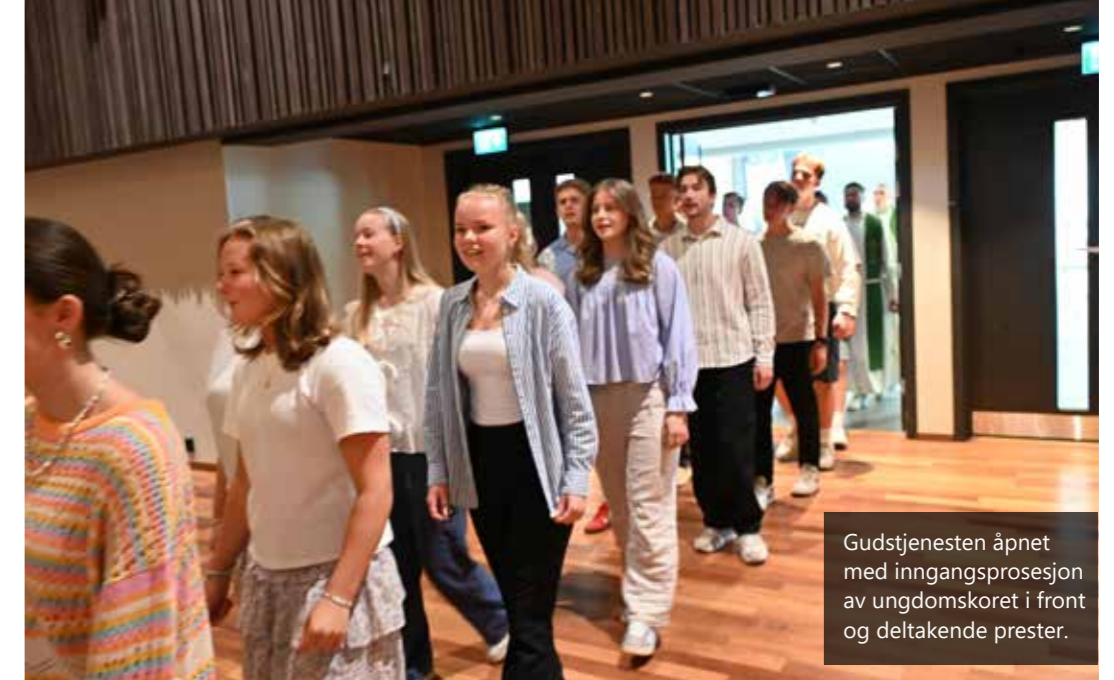
Gudstjenesten åpnet med inngangsprosesjon av ungdomskoret i front og deltakende prester.

Dørene til Torp konferansesenter i Sandefjord er ikke særlig spektakulære. De er som glassdører flest. Til gjengjeld er det ganske mange dører der. En dør fører ned en trapp og inn til møtesalen som ble brukt til barnemøter. Det er en enorm oppmuntring å se så mange barn, ungdommer, voksne og eldre samlet på ett og samme stevne. Det gir glede for dagen og håp for i morgen!