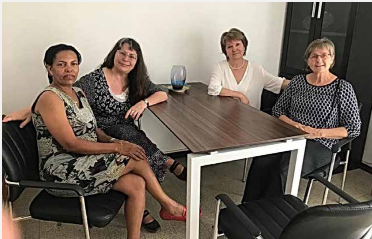
Noen av medarbeiderne i Machase.

Via Den norske Israelmisjon (DNI) har DELK støttet Machase siden 2022. Krisesenteret Machase har bare én deltidsansatt og beskjedne driftskostnader, siden det meste av arbeidet i Machase gjøres på dugnadsbasis.