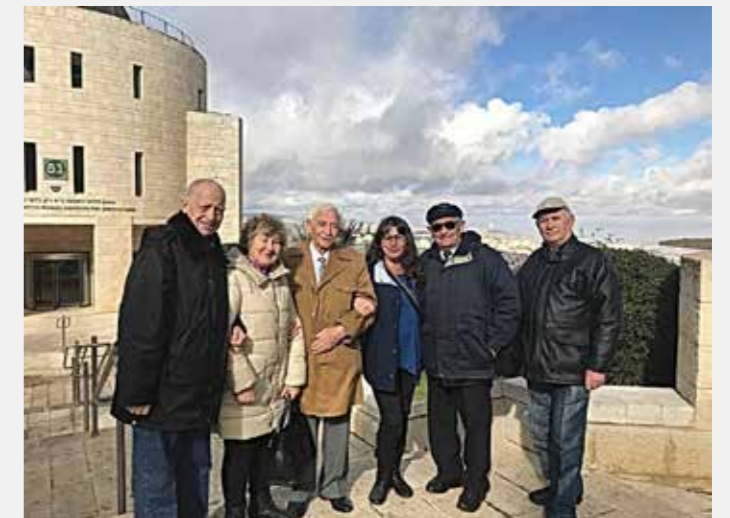
Noen av de Holocaustoverlevende.