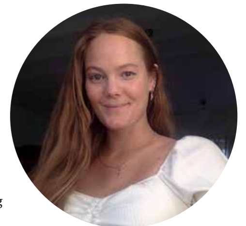
Benediktedeler fra et volontøropphold i Tel Aviv, Israel.

Det finnes barn og unge som vokser opp i en kirke og familie hvor landet og folket Israel blir nevnt, og kanskje til og med bedt for. Slik var det ikke for meg; jeg visste svært lite om Israel og jødene, selv om jeg vokste opp i en kristen familie og gikk mye i kirken. Men etter å ha blitt invitert inn i en Facebook-gruppe der administratoren hadde et hjerte for