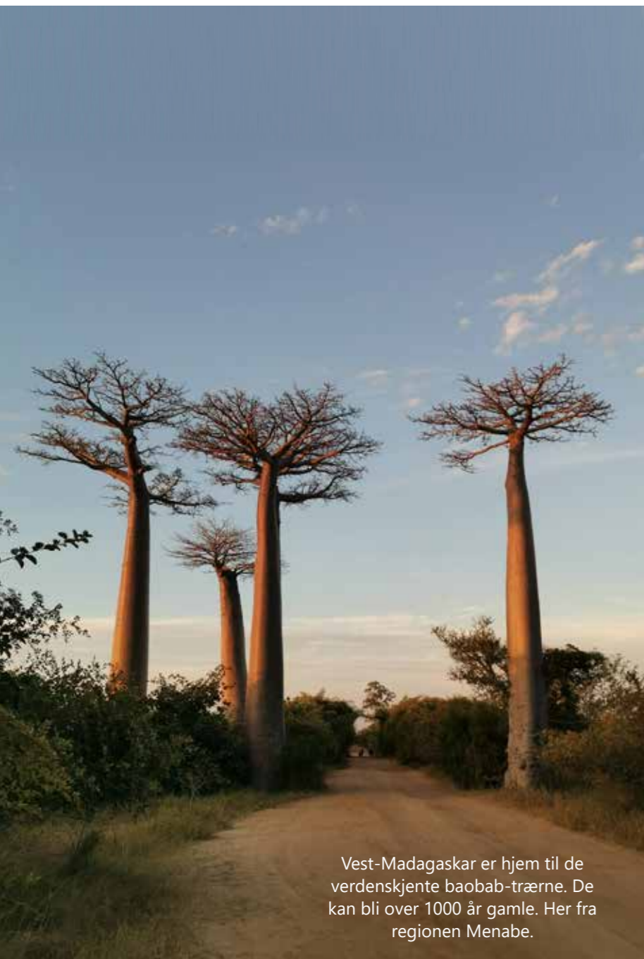
Vest-Madagaskar er hjem til de verdenskjente baobab-trærne. De kan bli over 1000 år gamle. Her fra regionen Menabe.

TEKST / KRISTOFFER HANSEN-EKENES, MISJONÆR PÅ MADAGASKAR