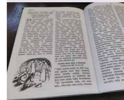
Slik kan en trykt utgave av Lukas-evangeliet se ut. Her på Analalava-sakalava.