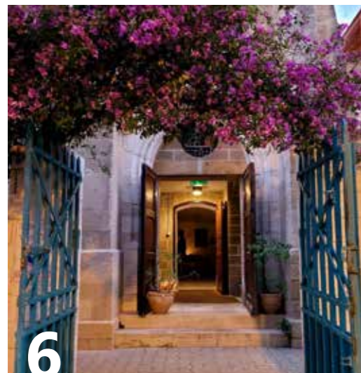
6 En forsmak på årets stevne