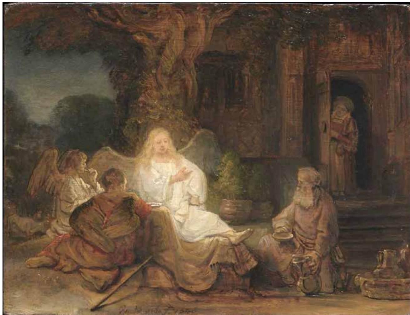
Rembrandt van Rijn, Abraham som tjener de tre englene (1646)

Rembrandt har også tatt med mange andre detaljer fra fortellingen i 1. Mosebok 18: Abraham som ikke bare tilbyr at gjestene skal få vasket sine føtter (v. 4), men som selv sitter klar til å gjøre det. I bakgrunnen ser vi Sara i døråpningen på huset; i teksten står hun i teltåpningen (v. 9–10). Men i alle detaljene i scenen under eiketrete, er det én person som fremheves: Det er Gud som åpenbarer seg i Kristi skikkelse, han som er den usynlige Guds bilde.