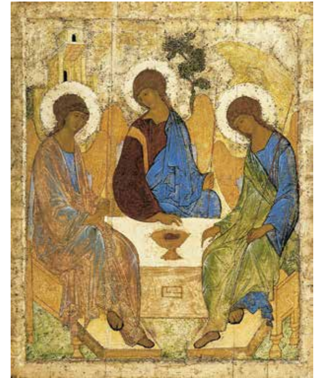
Andrei Rublev, Treenigheten (1400-tallet)

Hvem er så HERREN i denne teksten? De tidlige kirkefedrene var ikke i tvil om svaret: Det var Kristus. Vi har kanskje lett for å tenke at Kristus først kom inn i verden da han ble født i Betlehem. Men Det nye testamentet er klar på at Guds Sønn var fra evighet av. Han som i Johannesevangeliet kalles Ordet, «var i begynnelsen hos Gud» og «alt er blitt til ved ham». Og det var han som «ble menneske» (Joh 1,1–3 og 14). Gud Fader er usynlig, men Sønnen er «den usynlige Guds bilde» (Kol 1,15). Det betyr at alle steder der det er tale om at Gud åpenbarer seg i menneskelig skikkelse, er det i Sønnens skikkelse. Det var ham Abraham så – sammen med to engler.