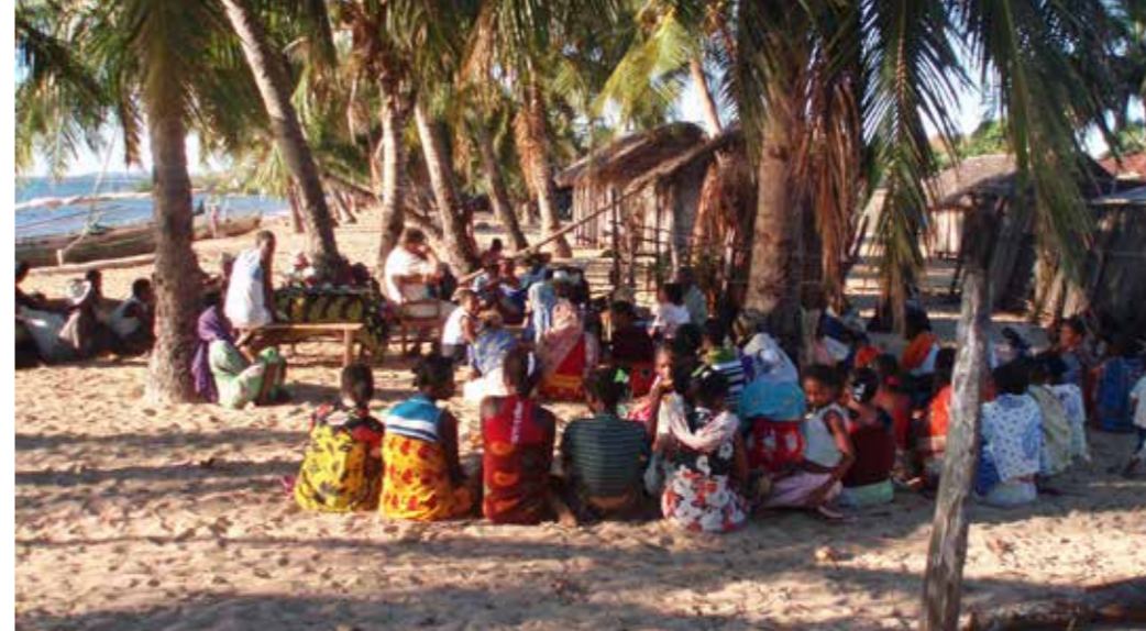
Landsby på vestkysten nord for Mahajanga, hvor språket Bemazava-sakalava hører til.

Gult lys er i grunn en håpefull tilstand.