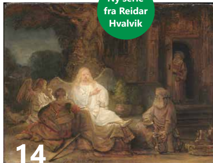
14 Kunst og bibeltekster