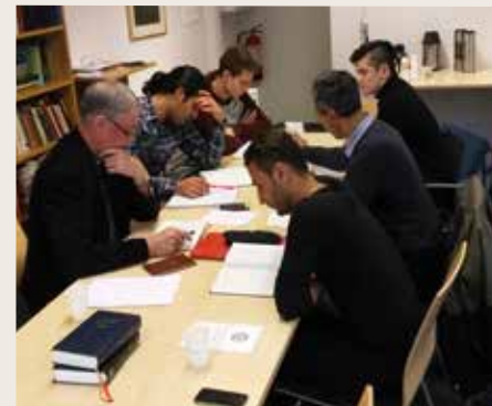
Den persiske bibelgruppen har samling rundt Ordet.