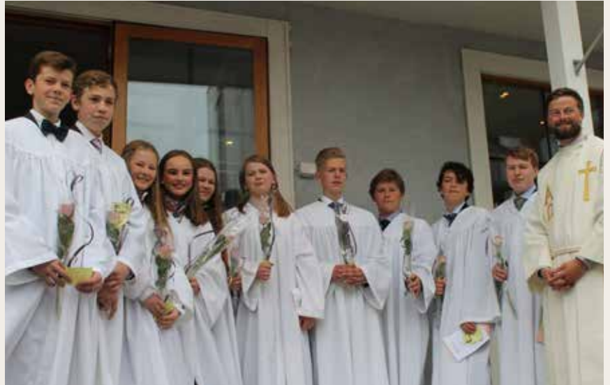
Konfirmantene i Moe kirke i Sandefjord samlet på kirketrappen etter konfirmasjonen

Søndag 7. mai hadde menigheten konfirmasjon for ti flotte konfirmanter. Gudstjenesten fant sted i Norkirken Sandefjord. (Det er fint å se at menigheten noen ganger vokser ut av kirken og at vi har grunn til å gå igang med bygging utvidet kirkerom i juni!)