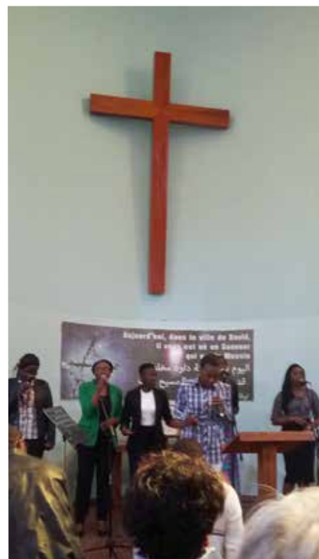
Vi deltok i en gudstjeneste – de fleste var fra andre afrikanske land.