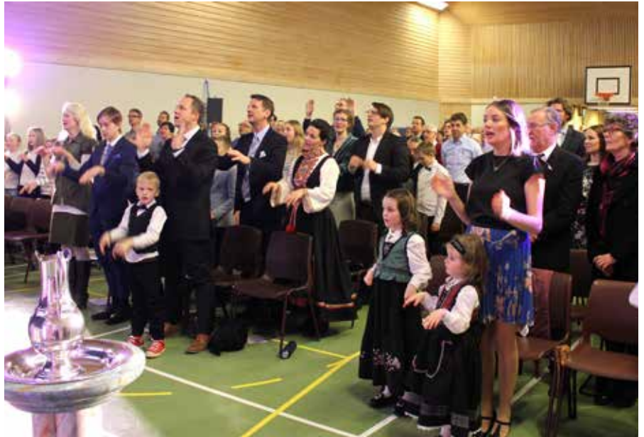
Fra gudstjenestefeiringen i forbindelse med Skauen kristelige skoles 40-års jubileum.

Av plasshensyn er prekenen noe forkortet. Hele prekenen kan du lese på www.granlymenighet.no .