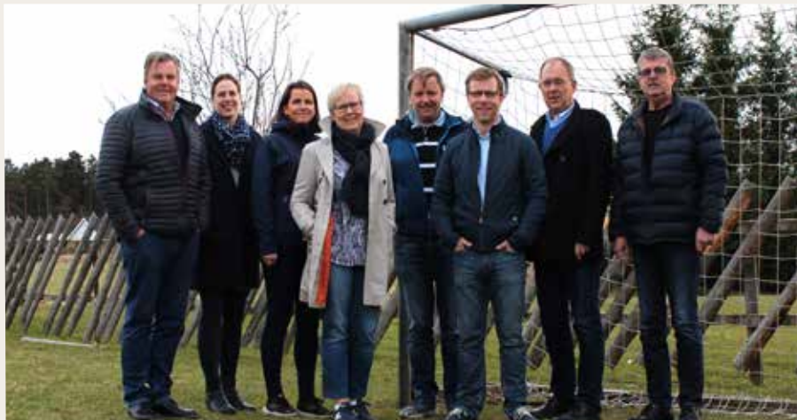
Målfoto. Selv om komiteen her står oppstilt foran nettmaskene, er de ikke helt i mål med byggesaksarbeidet enda.