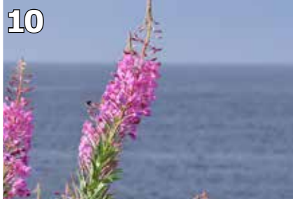
Klimakrisen - angår det kirken?