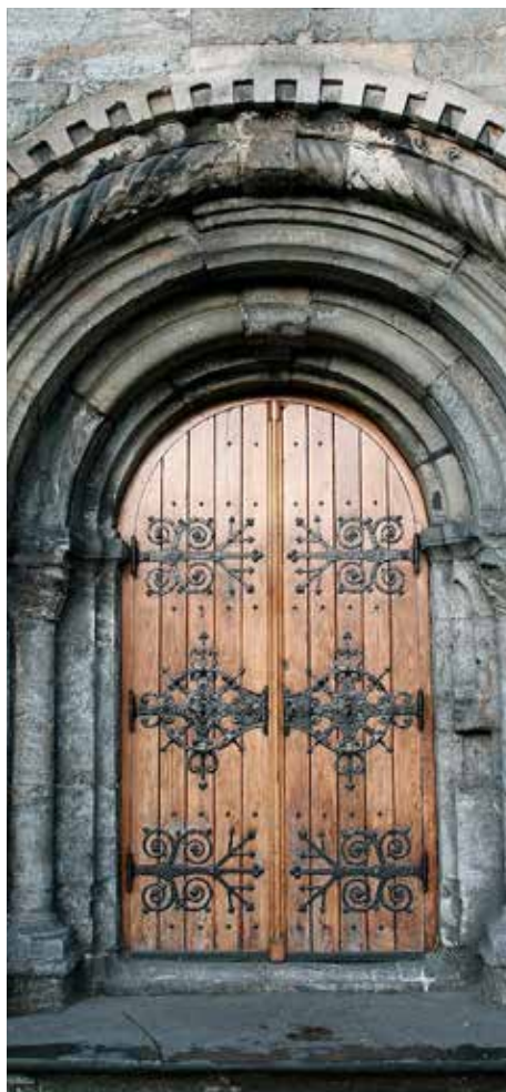
Illustrasjonsfoto: Sørportalen i Mariakirken i Bergen.

Men nettopp som aktive kristne er i ferd med å nærme seg en mer bibelsk holdning til syndsbegrepet, dukker pietismens adiafora-tenkning opp på et nytt og kanskje litt uventet sted, nemlig hos journalister i sekulære media. «Er homofili synd?» er et spørsmål som har slått mot oss fra nyhetsmediens websider de siste