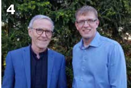
DELK får ny tilsynsmann