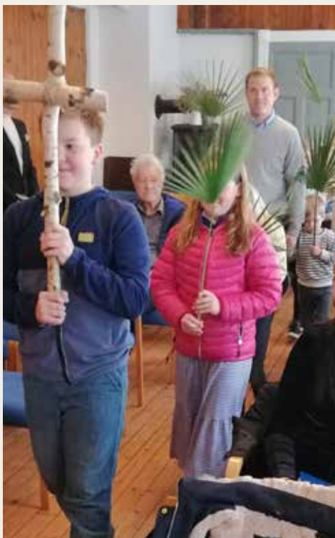
Menighetens barn i inngangsprosesjon.