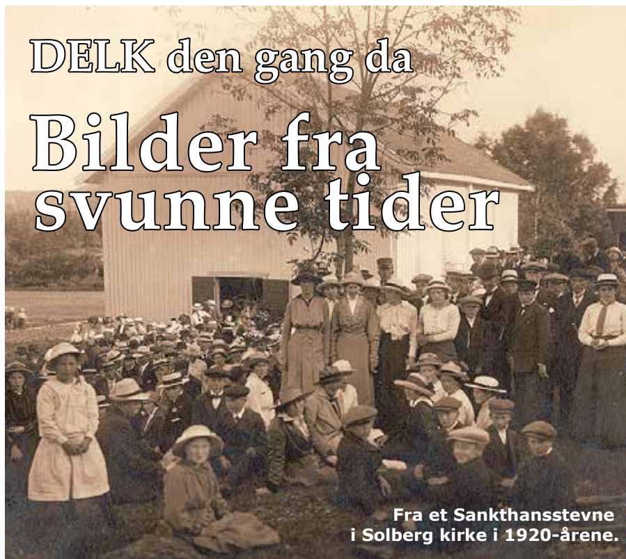
Fra et Sankthansstevne i Solberg kirke i 1920-årene.

Er du i besittelse av bilder som forteller noe om DELK i gamle dager? Hovedkontoret er på jakt etter det som måtte finnes av bilder som viser noe av det som var DELK – helst lenge før de fleste av oss som lever nå, var til.